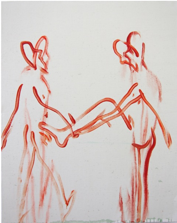
《bridge》 2016, oil on canvas, 910x727mm