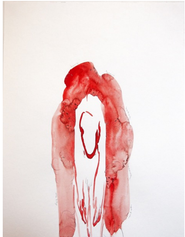
《difficult to move》 2016, watercolor and pencil on paper, 410 x 315 mm