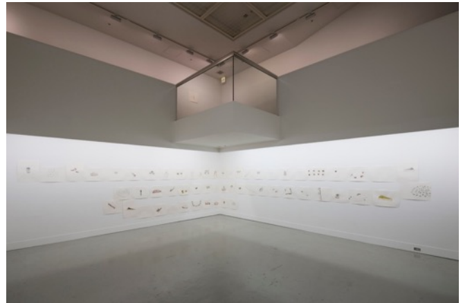
《SHISEIDO ART EGG vol.9 : Go down the throat》2015年 展覧会風景 (資生堂ギャラリー、東京)