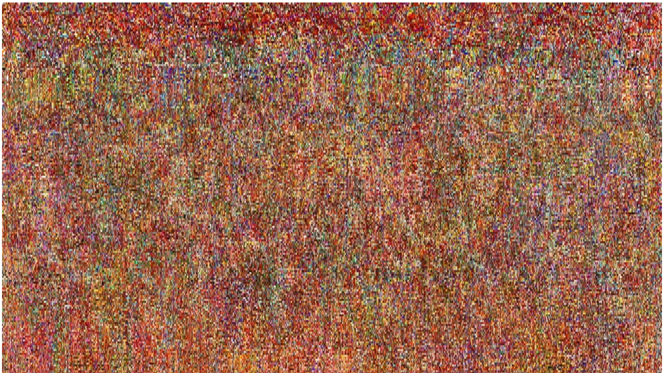
『Lines』 2013, ラムダプリント, 1000 x 570 mm

waitingroomでは2014年2月1日 (土) ～3月2日 (日) まで、武居功一郎 個展 『modality』 を開催いたします。waitingroomでの個展は3度目となる武居は、写真をコンピューターに取り込み、デジタル加工により作品を制作している作家です。「ピクセルを通して見える物質性と非物質性」をテーマにした、絵画なのか、写真なのか、また映像的要素も兼ね備えた、デジタルとアナログの境を行き来するような作風が特徴です。3年ぶりとなる今回の個展では、「視覚における触覚、運動感覚」をテーマにした新作を発表します。なお、同展覧会は2月7日～23日まで東京都写真美術館で開催される『恵比寿映像祭』の、地域連携プログラムに参加しています。