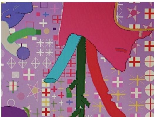
城戸熊太郎 まごな, 2011 ラムダプリント, 35.6 × 43.2cm