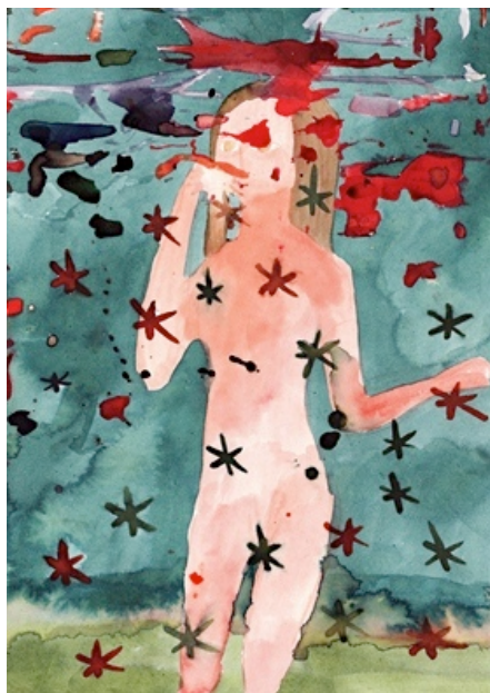
qp 無題, 2011 紙にインク, 37.6 × 26.8cm

qpは、アクリル絵具やカラーインク等を用いて、主に人をモチーフとした絵画を制作しています。その身体は抽象化され、精霊もしくは影に近い、人ではなくその痕跡だけを描いたような儚さを持ち合わせています。それは制作の技法にも通じており、支持体にゆるやかにたまり、染み込んでいくような流動的な筆致が特徴です。それはどこか特定の場面ではなく、流れる記憶の中で一瞬だけ思い出すことの出来るような、そんな儚い風景を描いているように見えます。