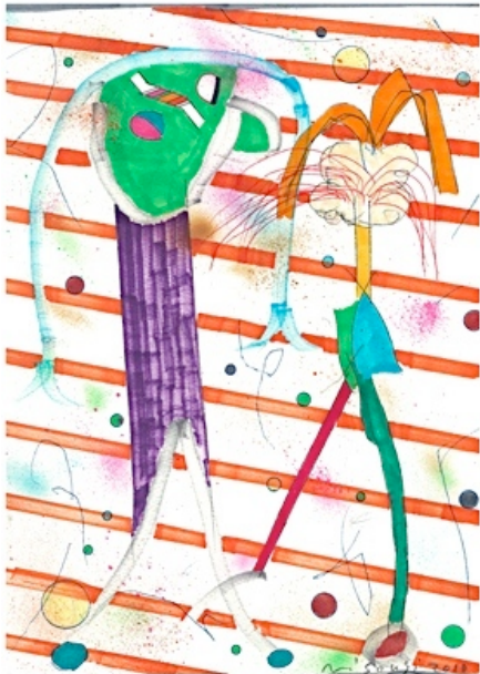
二艘木洋行 梨, 2010 紙、カーボン紙、コピック、297 × 210mm

このたび、waitingroomでは、6月23日（土）～7月29日（日）まで、二艘木洋行、qp、城戸熊太郎による『マゼンタ色の友だち』を開催いたします。