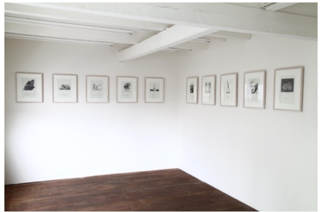
《芸術家十則ドローイング》2013-2014年、展示風景（Antenna Media、京都） 紙、鉛筆、インクジェットプリント