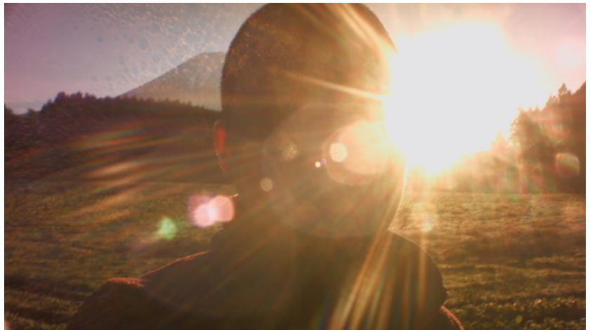
《アート (日本Ver.)》2015年、シングルチャンネルビデオ、サウンド、10min.5sec.