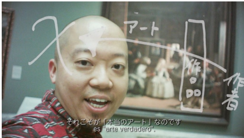
《アート（スペインVer.）》2015年、シングルチャンネルビデオ、サウンド、10min.5sec.