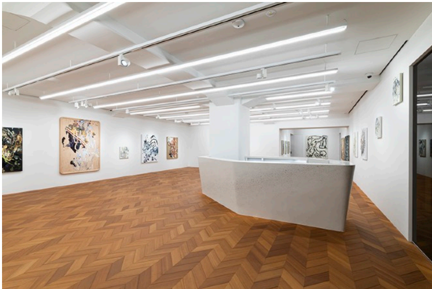
2022年個展『We are defenseless. / We are aggressive (無防備なわたしたち/攻撃的なわたしたち)』 会場風景 (日本橋三越本店 三越コンテンポラリーギャラリー、東京)