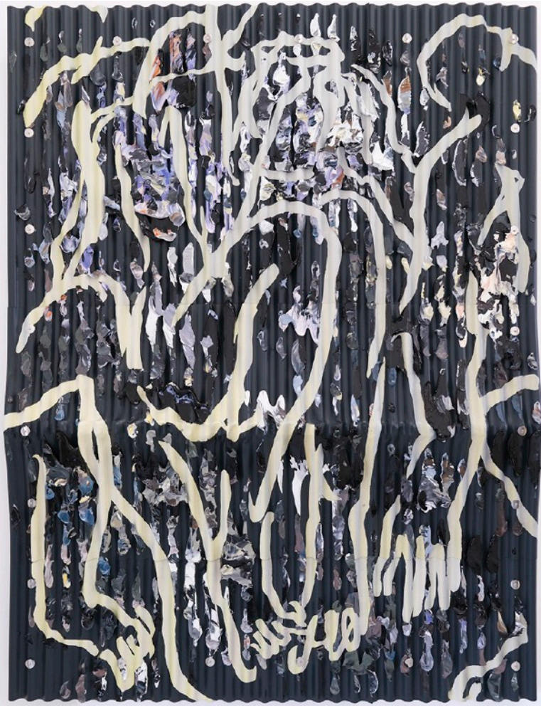
“They”, 2022 acrylic, and oil on corrugated plastics sheeting, H1237×W942mm