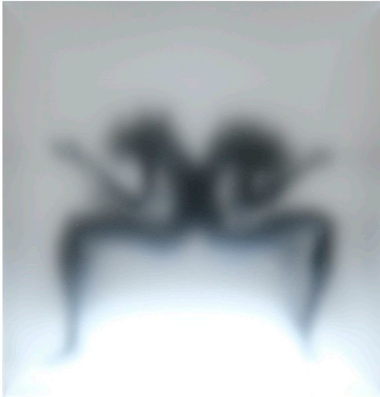
“Two Sorrows”（部分）, 2022, 石塑粘土、アクリルペイント、LEDライト、アクリルボックス、スチール、H356×W310×D310mm

WAITINGROOM（東京）では、2022年11月26日（土）から12月25日（日）まで、大久保紗也の、当ギャラリーでは2年ぶり3回目となる個展『Box of moonlight』を開催いたします。大久保は、輪郭線として表現される記号的なイメージと、物質感を伴う抽象的な像のうねりという、二つの分離した要素を共存させた絵画作品を主に制作しています。本展では、大久保が初めて取り組んだ立体作品の新シリーズを初公開いたします。石塑粘土で細部まで具象的に造形された人型のオブジェの上に、磨りガラスのように曇ったアクリルボックスを被せ、大久保の絵画作品に特徴的な、輪郭線の揺らぎやモチーフの混ざり、それらの視認の曖昧さといった要素を、新たな素材を用いて表現した新シリーズとなります。加えて、これまで大久保が支持体として用いてきた波形のトタン板が、さらに屋根状に折れた素材を支持体とする、より立体感を増した新作の絵画作品も発表いたします。