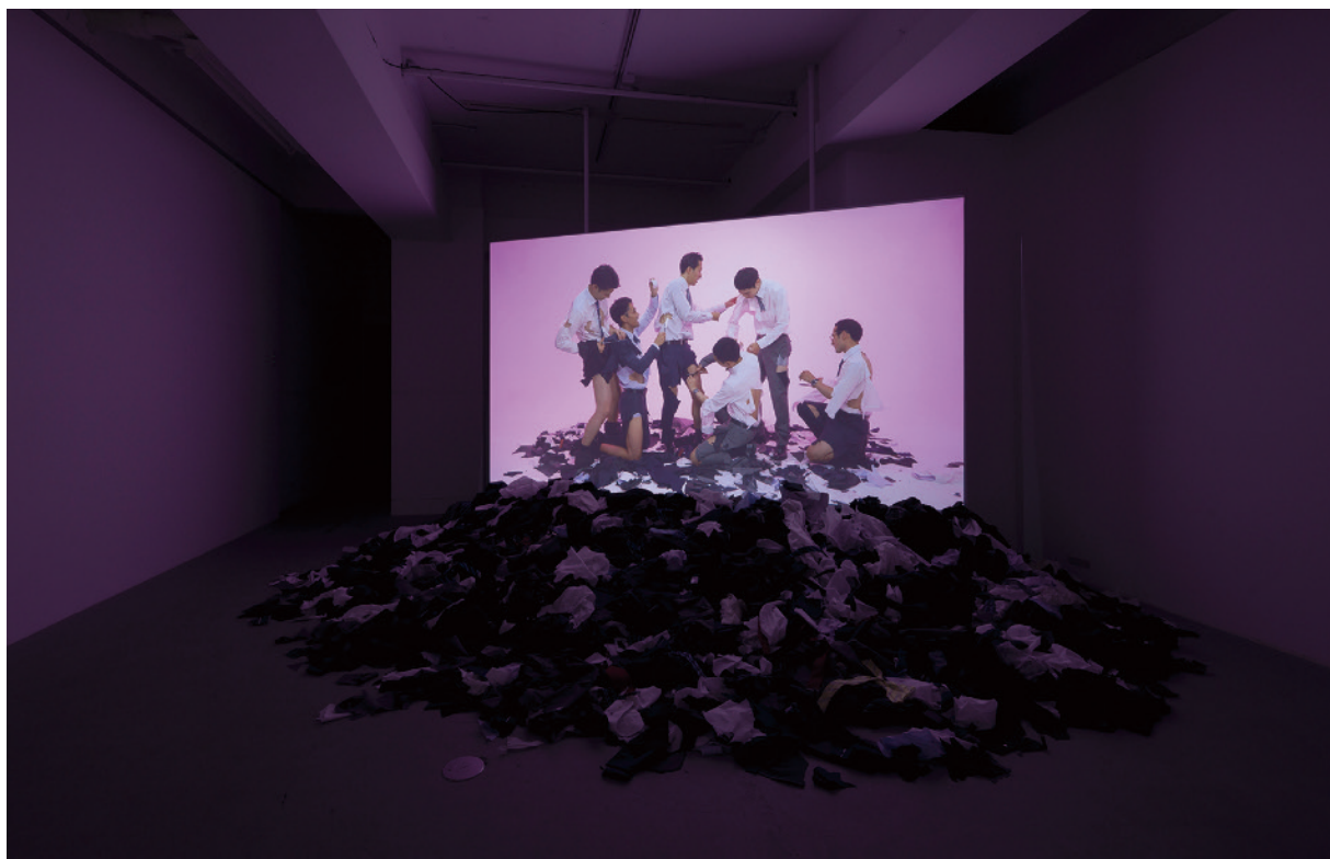
『Cut Suits』2023年 installation view

Art Basel Hong Kong 2024でのソロプレゼンテーションでは、2023年9月のWAITINGROOMでの個展で発表した最新作『Cut Suits』(2023)と『The Butterfly Dream』(2022)を、アートフェアのブースの中に再構成し展示します。作中で実際に使用した小道具を展示するほか、作中のイメージが展示空間まで広がったようなインスタレーション的表現など、映像作品をより空間的に展示いたします。