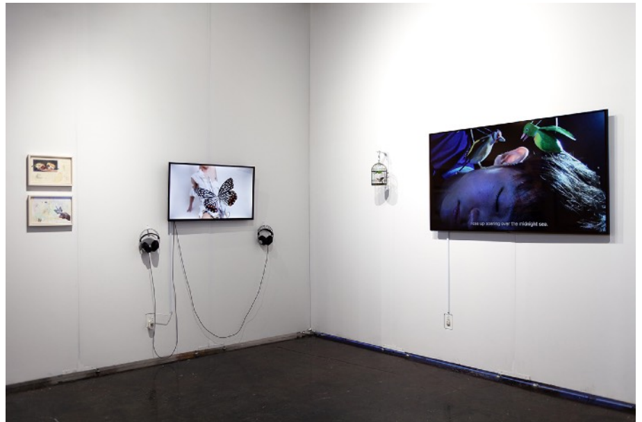
2022年『NADA Miami 2022』 (Ice Palace Studio、マイアミ、アメリカ) 展示風景