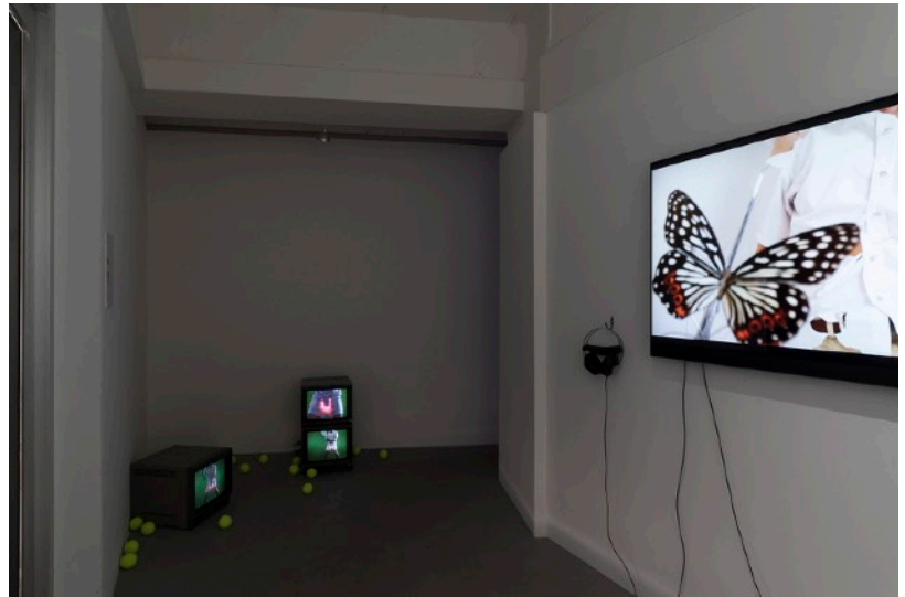
2023年 個展『Cut Pieces』 (WAITINGROOM、東京) 展示風景