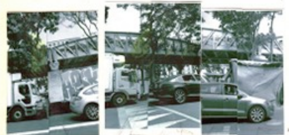
オノデラユキのエスキースより