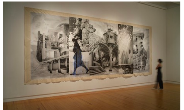
2024年グループ展 「Focus」 マウイアート&文化センター (ハワイ、アメリカ) 展覧会風景