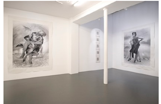
2017年個展「IMPROMPTUS」 ビエール・イヴ・カエール・ギャラリー (パリ、フランス) 展覧会風景

国立近代美術館・ポンピドーセンター (Musée National d'Art Moderne, Centre Pompidou) フランス国立現代美術コレクション (Fonds National d'Art Contemporain, Paris) パリ市現代美術コレクション (Fonds Municipal d'Art Contemporain, Paris) 国立ニセフォール・ニエプス美術館 (Musée Nicéphore Niépce, France) フランス国立図書館写真コレクション (Bibliothèque Nationale de France) ハイスマルセイユ写真美術館 (Huis Marseille, Museum for Photography, Amsterdam) ヒューストン美術館 (The Museum of Fine Arts, Houston, Texas, U.S.A.) サンフランシスコ近代美術館 (San Francisco Museum of Modern Art, California, U.S.A.) ポール・ゲッティ美術館 (The J. Paul Getty Museum, Los Angeles, U.S.A.) ピーボディ・エセックス美術館 (The Peabody Essex Museum (PEM) of Salem, Massachusetts, USA.) デュドランジュ市 / ルクセンブルグ (La ville de Dudelange / Centre d'art Nei Licht, Dudelange, Luxembourg) ファン・デン・エンデ財団 (Fondation Daniel et Florence Guerlain, France) グラン財団 (Fondation Daniel et Florence Guerlain, France) 上海美術館 (Shanghai Art Museum) 三影堂アートセンター / 北京 (Three Shadows photography Art centre, Beijing) ソウル写真美術館 (The Museum of Photography, Seoul) 東京国立近代美術館 東京都写真美術館 栃木県立美術館 群馬県立近代美術館 国立国際美術館 愛知県立美術館 国際交流基金 川崎市民ミュージアム 桑沢デザイン研究所 東京工芸大学 東川町 (北海道) 東京オペラシティアートギャラリー amanaコレクション