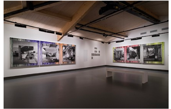
2022年個展 「La clairvoyance du hasard」 ムージャン写真センター (ムージャン、フランス) 展覧会風景