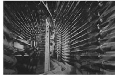
空気郵便(La post pneumatique)のネットワーク パリの地下、あちこちに設置された迷路の様な金属管