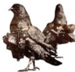
カメラを持った鳩 pigeon photographer