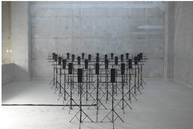
「第72回東京藝術大学 卒業・修了作品展」 東京藝術大学 (東京)