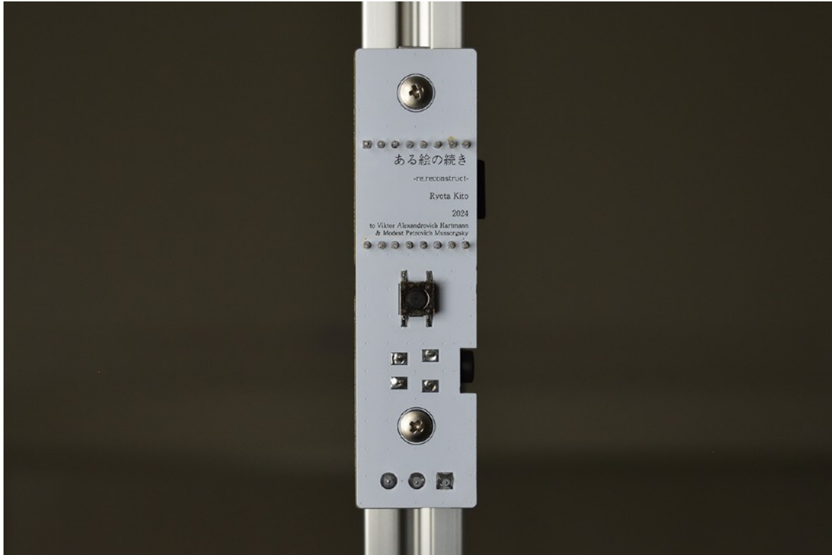
『ある絵の続き / re-reconstruct』メインビジュアル

WAITINGROOM（東京）では、2024年12月14日（土）から2025年1月19日（日）（冬季休廊期間：2024年12月29日（日） - 2025年1月7日（火））まで、木藤遼太の当ギャラリーで初めて、そして木藤自身のキャリアの中でも初めての個展『ある絵の続き / re-reconstruct』を開催いたします。木藤は、「彫刻」という最も物質性の強いメディアを自身の制作手法の中心としつつも、「形のないかたちで作られた彫刻」を模索しながら作品を制作しているアーティストです。近年では、『東京藝術大学修了作品展』（2024年）で発表した《82番目のポートレート》や、『ICCアニュアル 2024 とても近い遠さ』（2024年）で発表した《M.81の骨格——82番目のポートレート》など、「音」を素材の中心に制作と発表をしてきました。木藤自身にとって初めての個展となる本展でも、近年の実践と地続きになった「音」を素材の中心とした新作を制作しました。瞬間芸術ともいわれる音楽を、どうやって空間内に留めるのか。この問いと共に「永遠性」についても考えながら、何度でも組み直せるように設計された格子状の彫刻、そこを行き来するように流れる音源、物理的な記録媒体＝彫刻としてのレコード作品が、インスタレーション作品としてギャラリー空間内に展開されます。ぜひご高覧ください。