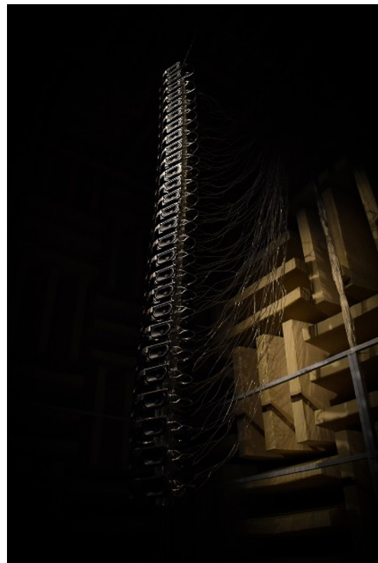
木藤遼太 《M.81の骨格——82番目のポートレイト》 2024年